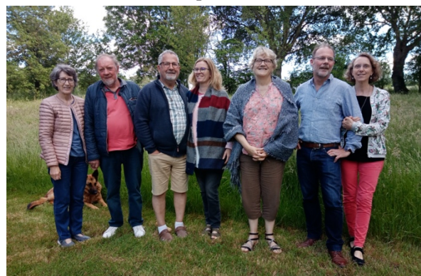
L'équipe ACI de Meslay du Maine

Ces réunions d'ACI resserrent nos liens d'amitié et de confiance. Elles permettent de mettre nos vies en face de l'évangile afin d'éclairer notre chemin, dans le monde dans lequel nous vivons.