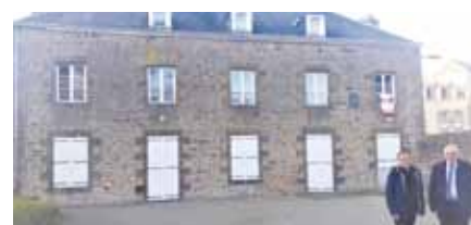
M. le curé de la paroisse et M. le maire d'Ambrières-les-Vallées devant la maison paroissiale.

Au programme : le remplacement des huisseries avec double vitrage et maintien des volets existants en bois ; le renforcement de l'isolation des murs du rez-de-chaussée, une isolation en combles perdus et au droit du plancher bas