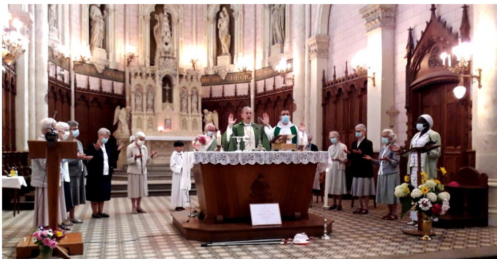
Les sœurs entourent notre évêque au moment du Notre Père