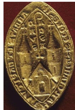
Sceau de l'abbaye retrouvé à S t Loup du Dorat

L'abbaye cistercienne aurait été fondée en 1150.