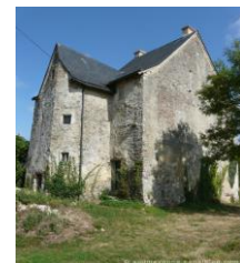
La Tour S t Michel

Détruite pendant la Révolution, il ne subsiste que la tour Saint Michel, le moulin et quelques bâtiments.