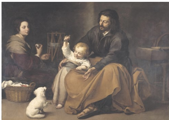
La Sainte Famille au petit oiseau, 1645-1650, Musée du Prado, Madrid

Pour en savoir plus : http://www.vatican.va/content/francesco/fr/apost_letters/documents/papa-francesco-lettera-ap_20201208_patris-corde.html