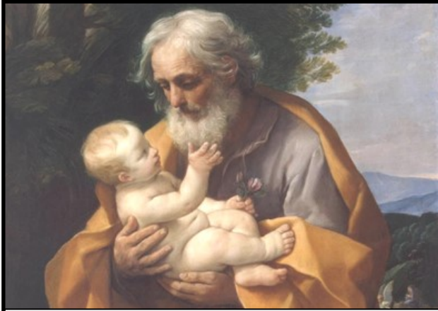
St Joseph avec l'Enfant-Jésus, Guido Reni, 1620, Musée de l'Ermitage, Saint-Pétersbourg

Voici la prière du Saint Père publiée à cette occasion